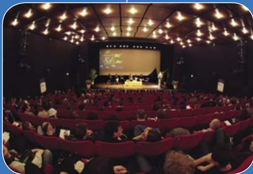
La Salle Catinat, lieu du colloque

Globalement, l'ensemble des intervenants encourage le «parcours européen» comme première étape avant d'envisager un «parcours international». La formation tout au long de la vie est évoquée pour montrer