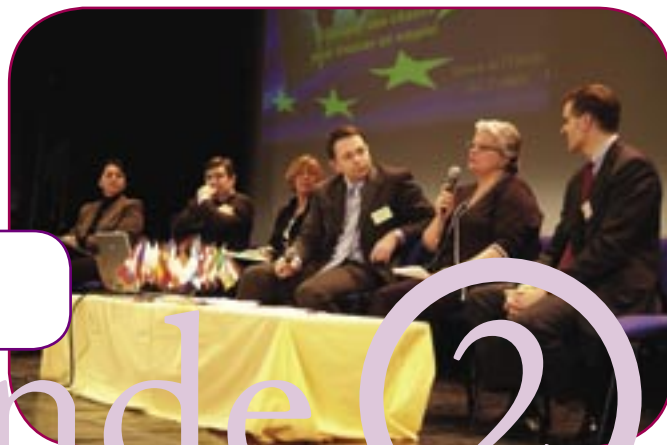
Table ronde 2

Comment étudier et travailler en Europe?