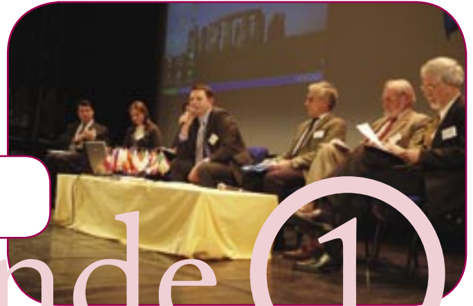
Table ronde 1