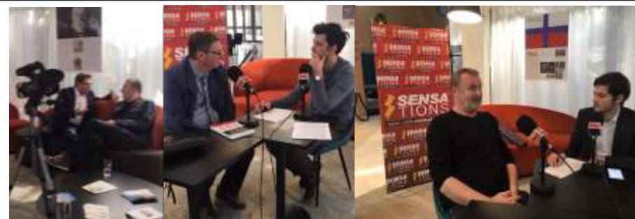
Conférence-débat « Les traités de paix garantissent-ils la paix ? » - septembre