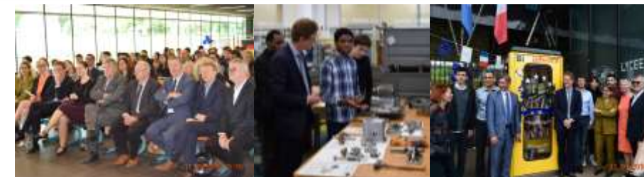
Inauguration de la BiblioboXX au lycée Léonard de Vinci - juin