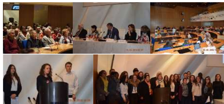
Conférence-débat « A quoi sert le Parlement européen ? » - mars