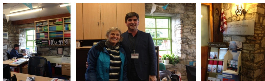
A Galway (Irlande) dans l'école de langues