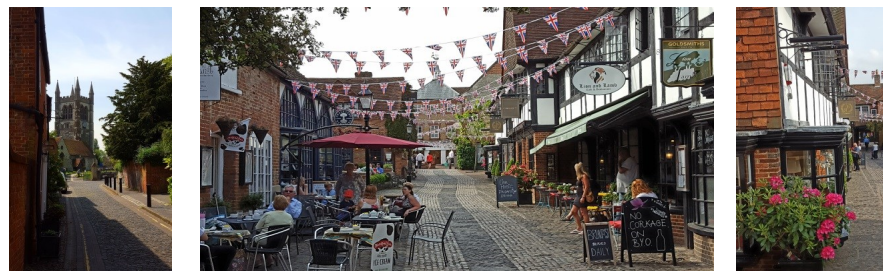
Woking, banlieue londonienne

Un stage professionnel de 15 jours dans 6 pays européens leur est proposé : Espagne, Bulgarie, Irlande, Royaume Uni, Finlande et Allemagne. Les périodes sont libres. Il s'agit en fait d'une individualisation du parcours professionnel puisque ces participants peuvent choisir le pays d'accueil et le type d'entreprise dans laquelle ils veulent effectuer leur stage. Comme pour les jeunes, les adultes doivent être motivés et volontaires avec le désir d'évoluer dans leur carrière et de faire progresser leur structure vers une nouvelle dimension et notamment européenne.